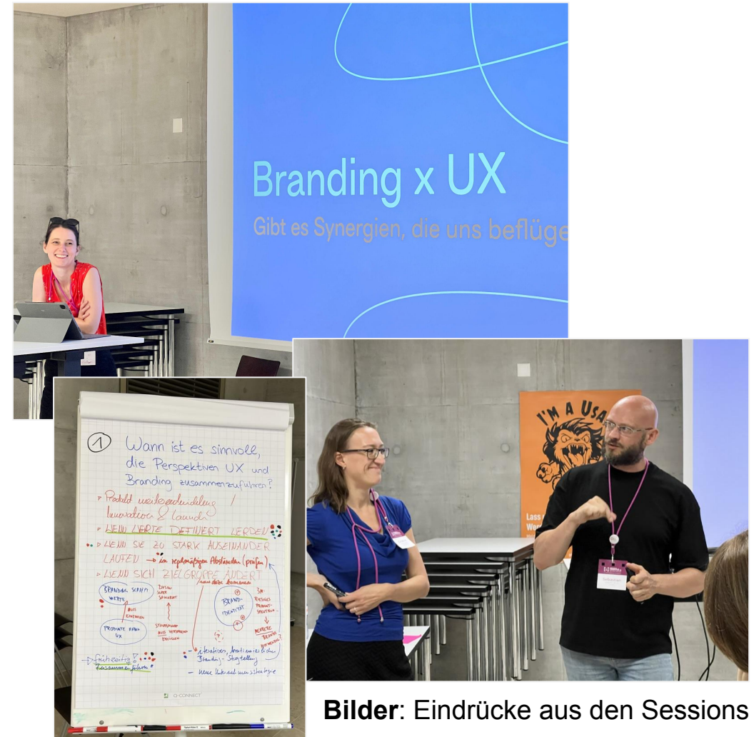
Bilder: Eindrücke aus den Sessions